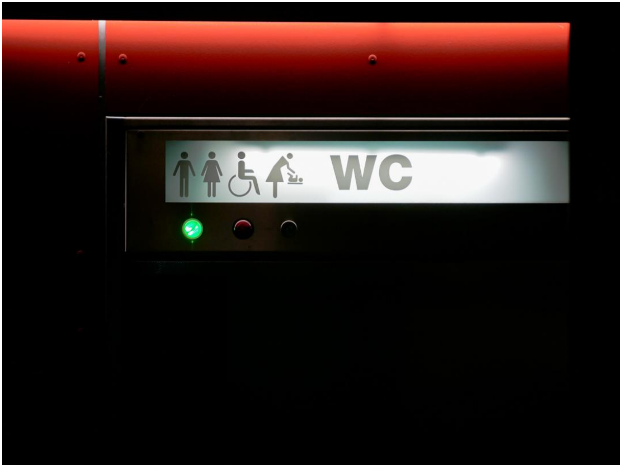
Öffentliche Toilette am Albtorplatz