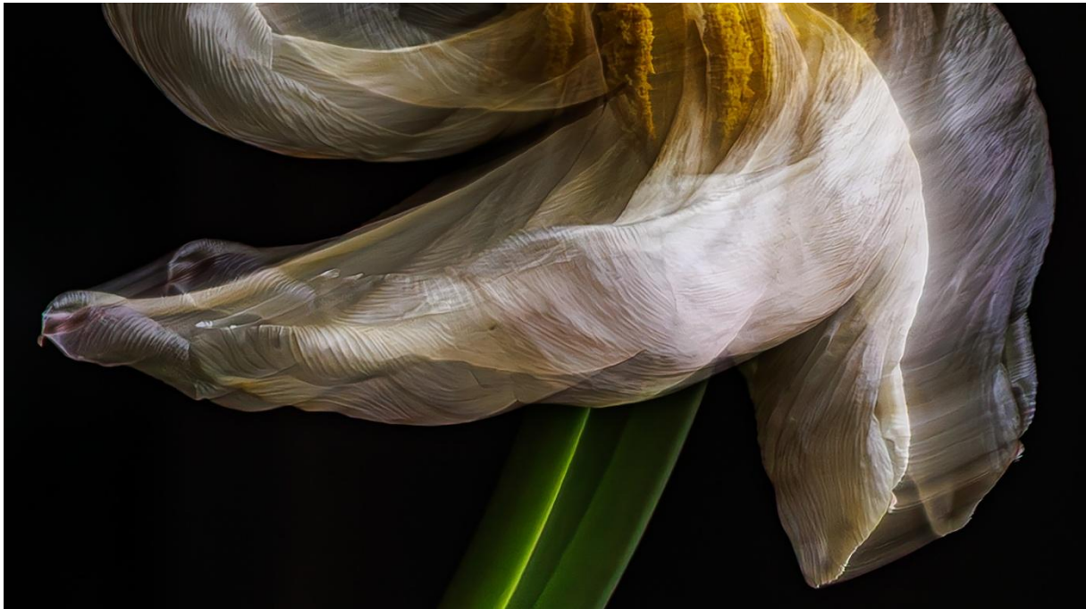
Tulpenblüte – der letzte Tanz

Hier ein Beispiel aus einer Bildbesprechung von 2025: