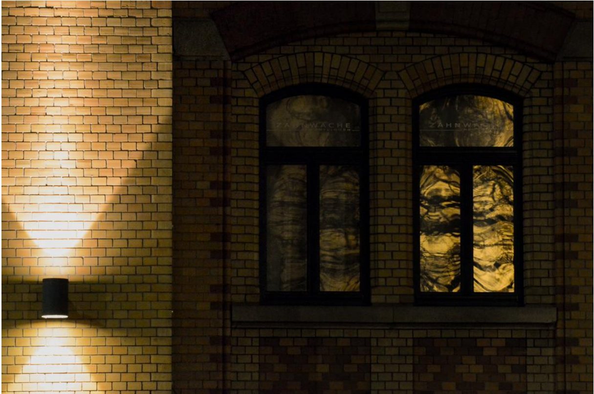
Alte Feuerwache Lederstraße