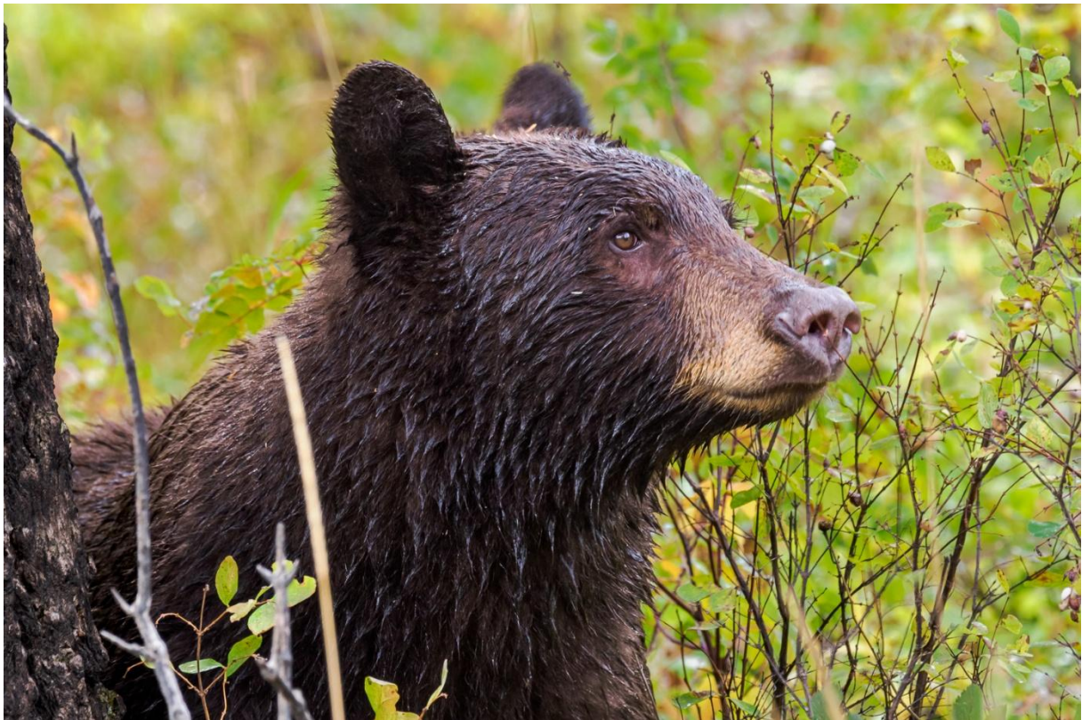
Frisch aus dem Wasser: Braunbär im Teton Nationalpark