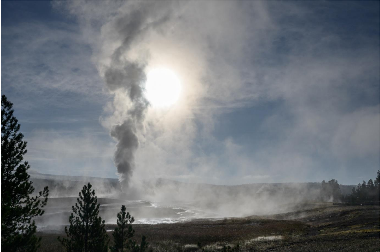
Geysir Old Faithful