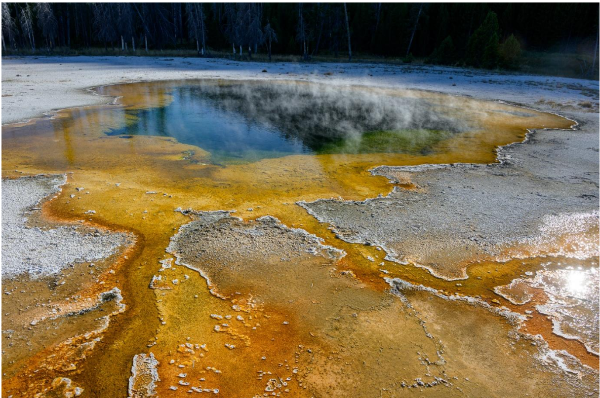
Orange und Blau – das sind die Farben der Heißwasserpools im Yellowstone Nationalpark