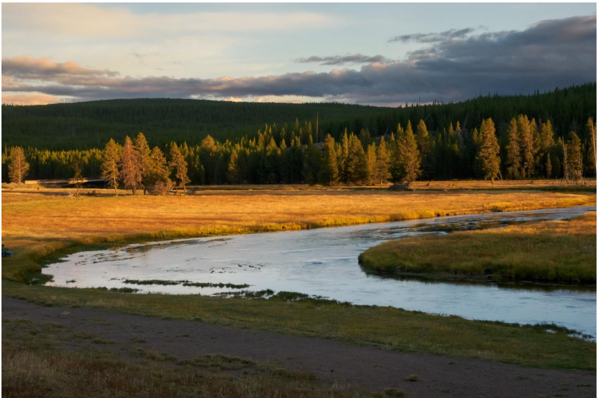
Madison River im Yellowstone Nationalpark

Wir zeigen heute Fotos aus dem Yellowstone Nationalpark, dem ältesten der Welt. Im Nordwesten der USA gelegen, ist er bekannt für seine Geysire und Schlammtöpfe. Eines unserer Bilder zeigt den bekanntesten Geysir, den Old Faithful, dessen Wassersäule 35-50 Meter hoch ist. Weniger bekannt als Yellowstone ist der benachbarte Nationalpark Teton mit seiner reichhaltigen Tierwelt: Biber, Elche, Bisons, Hirsche, Bären, Adler.